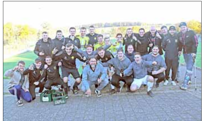
Siegreiche 1. und 2. Mannschaft