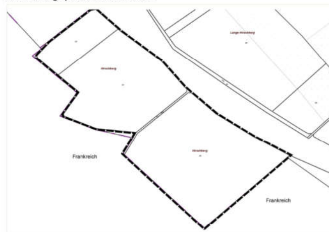
Abbildung: Geltungsbereich des Bebauungsplanes

Die genaue Abgrenzung des Geltungsbereiches ist der Planzeichnung zum Bebauungsplan und der folgenden Abbildung zu entnehmen. Der Geltungsbereich der FNP-Teiländerung ist mit dem Geltungsbereich des Bebauungsplanes identisch.